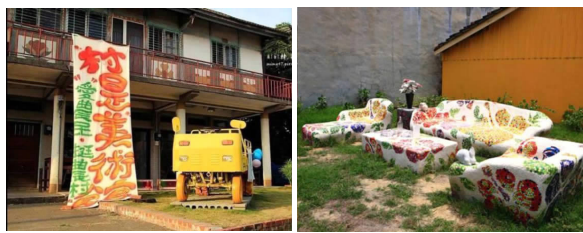
图3 “村就是美术馆,美术馆就是村”的土沟村

越来越多的青年艺术家、设计师、大学生进入土沟村参与实践,还成立了“土沟村文化营造协会”,与村民一起探讨乡村改造和环境更新,经过十年的努力,在2013年成立了台湾第一个“农村美术馆”,将农村市集、田园播种等与艺术融合,以文化创意引领乡村的发展,创造了“村就是美术馆,美术馆就是村”的新型乡建模式。在这种模式下,驻村艺术家与村民一起进行深度文创挖掘,将“农村美术馆”概念衍生出手工业、旅游业、休闲观光业等多种文化创意产业,引导传统农业向精致农业、创意农业方向发展。文化的复苏与创意经济的发展,也吸引了更多的知识型人才返乡创业,持续推动乡村的发展 [9] (如图3所示)。