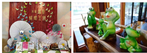
图2 桃米村打造的“青蛙王国”与“蝴蝶王国”

桃米村位于台湾地区南投县埔里镇。这个居住1200人的村落,曾是南投县最贫穷、最脏乱的乡村之一。1999年的台湾9·21大地震,这里处于震源中心区域,大部分房屋倒塌,成为地震受灾最严重的地方之一。随后,辅助灾后重建的研究人员发现这里有着丰富的生态资源,在“新故乡文教基金会”的支持和鼓励下,引入“社区总体营造”策略 [7] ,通过文化创意将艺术与产业相结合,以第一、第二产业转型升级为核心,第三产业精细化管理分工,打破第一、第二与第三产业之间的界限,进行融合发展,创造出新的经济增长点。经过十余年的发展,桃米村从一个脏乱差的偏远山村转变为生态文创型乡村。桃米村通过深挖在地资源,打造了生态IP概念的“青蛙王国”和“蝴蝶王国”,发展了以青蛙、蝴蝶为主题的文旅项目(如图2所示),截至2018年,桃米村每年文旅项目营业额达1亿新台币 [8] 。