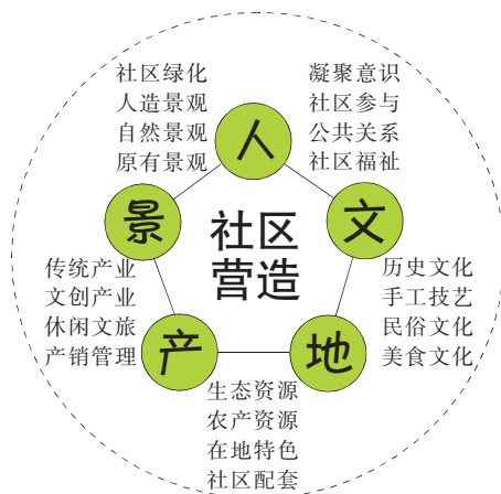
图 5 中国台湾地区“社区营造”的五大要素

中国台湾地区的文化创意发展较早,开始于 20 世纪七八十年代,那时的台湾地区经济处于高速发展阶段。经济高速发展的背后是大量农村人口涌向城市,到城市里生存,导致乡村日益凋敝。为了解决城市与乡村、大城市与小城镇等区域发展不平衡问题,1994 年,台湾地区“文建会”出台了“社区营造总体计划” [7] ,主要对“人、文、地、产、景”五个方面进行重构,以期塑造文化、产业、生活、人际关系、生态景观的和谐发展(如图 5 所示)。