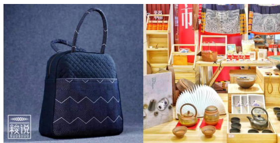
图4 新通道项目开发的“梭说”及“花瑶花”系列文创产品

2009年,湖南大学设计艺术学院与湖南通道县政府联合发起了“新通道”设计与社会创新夏令营活动,为偏远少数民族提供非遗保护、文化传播、产品创新及产业化提供设计支持,来自15个国家的大学、研究机构共400多名师生先后参与了湖南通道、隆回花瑶、重庆酉阳、四川雅安等地的乡村创新设计实践活动。设计团队扎根乡村,与地方政府、企业、村民共同探讨地方文化资源、自然资源的产业化发展之路。新通道项目本着“田野里的设计”“为传统而设计”“为幸福感而设计”的理念,将当地独特的文化、自然资源与现代创意相结合,开发了多种文化旅游商品,培育了自主文创产品品牌“梭说”,将文创产品的手工制作与精准扶贫相结合(如图4所示),解决了600多户村民的脱贫问题,并与国内电商巨头展开合作,建设了“乡home”文创公益电商平台,线下与各大商场合作,开创了20000平方米的销售空间 [11] ,将文化创意与“精准扶贫”紧密结合起来,取得了突出的社会效益与良好的经济效益。