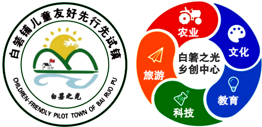
图 1 “白箬之光”乡创中心品牌 logo 及服务范围

自然教育是指在自然实践中倡导人与自然和谐关系的教育,包括自然知识型教育、自然体验型教育、自然游学型教育以及自然研究型教育。作为连接“人与自然”“人与人”“人与自我”的自然教育重新出现在人们视野中,为乡村建设和教育提供了新思路。乡村拥有丰富的多样的